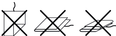
Abbildung 2 Figure 2 Image 2